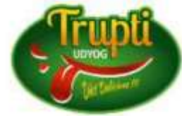
Trupti Udyog Nashik