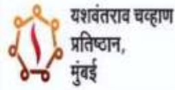
Y B Chavan Centre Mumbai