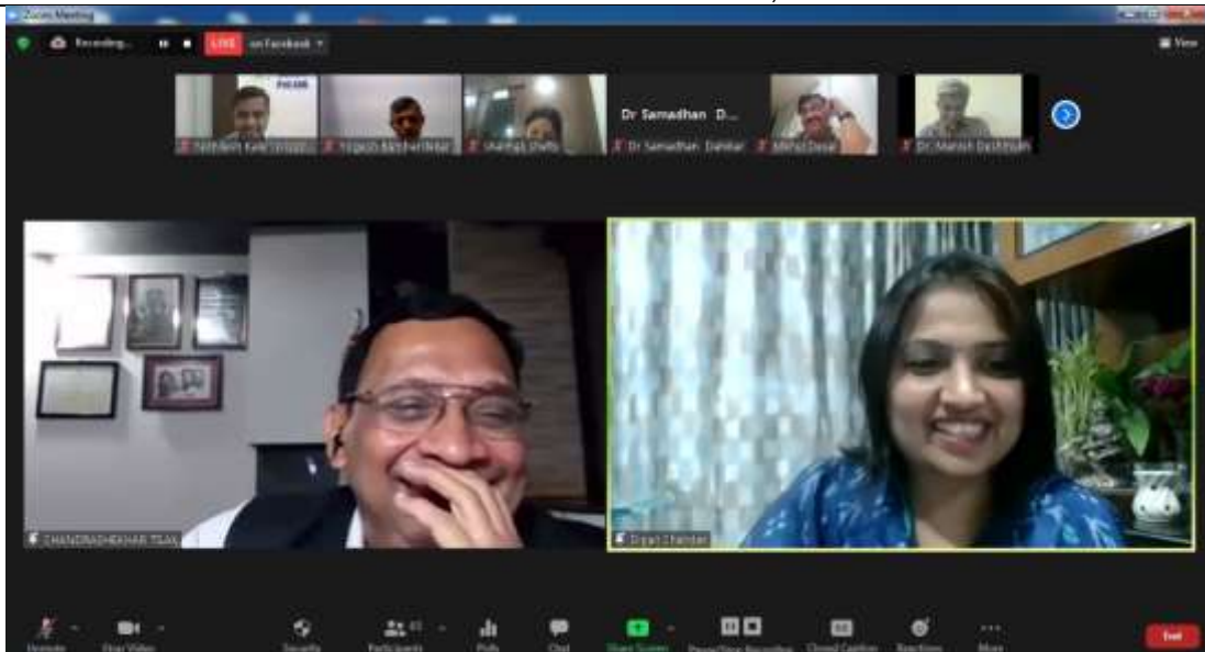
Glimpses of Seminar